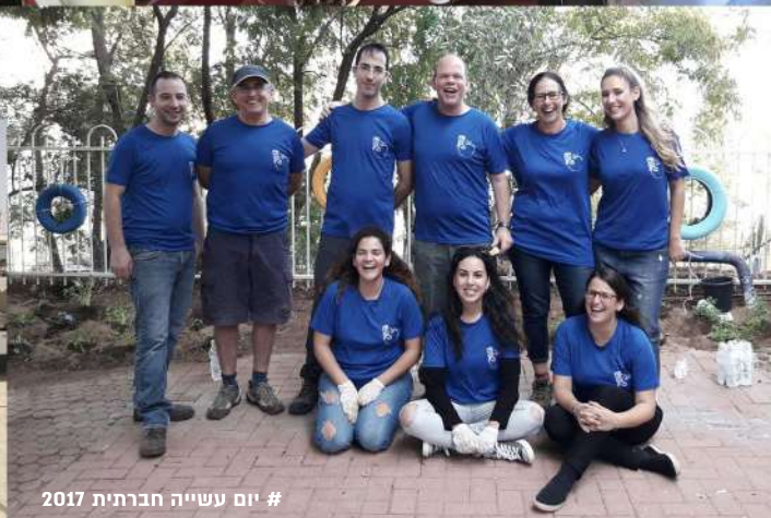
# יום עשייה חברתית 2017