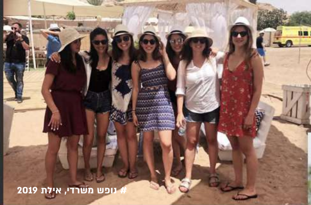
# נופש משרדי, אילת 2019