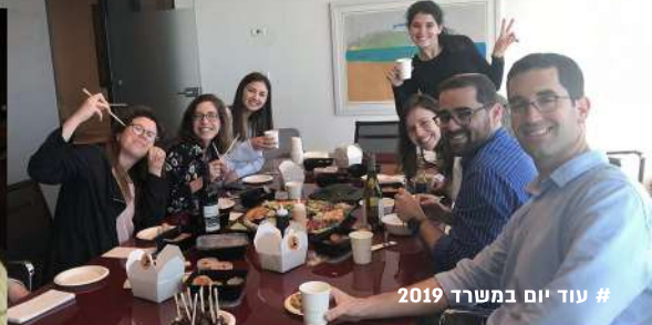
# עוד יום במשרד 2019