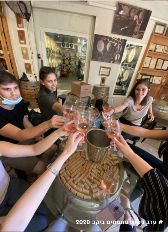
# ערב לינוש מתמחים ביקב 2020