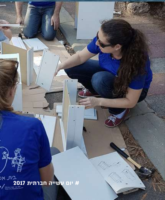
# יום עשייה חברתית 2017