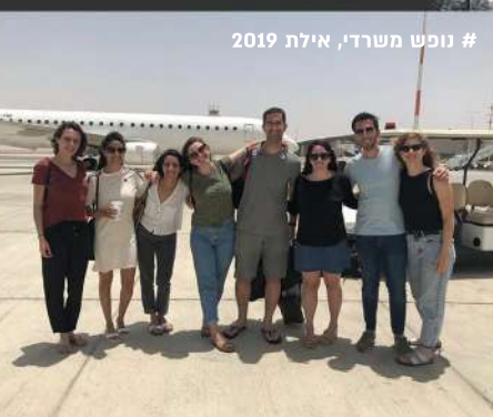
# נופש משרדי, אילת 2019