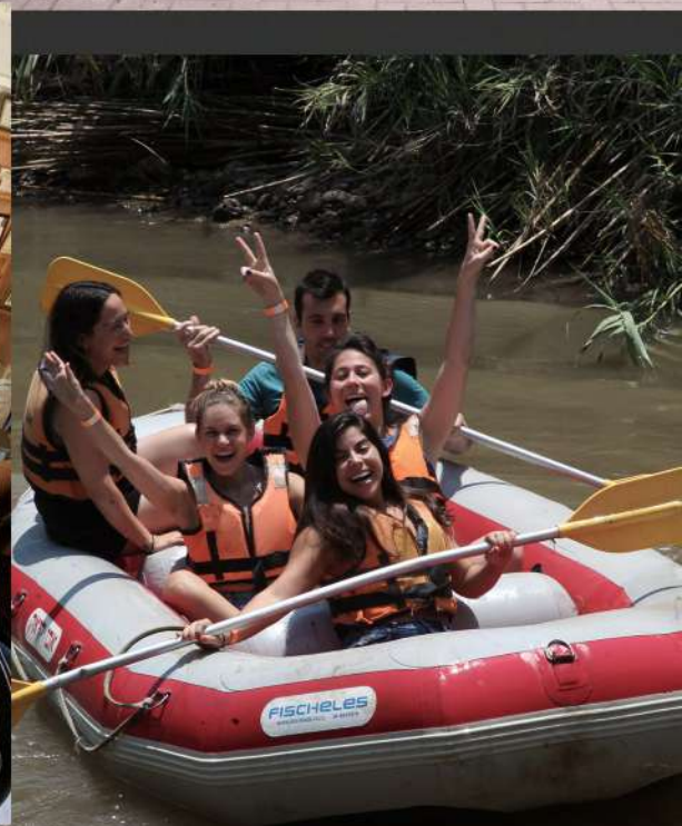
# נופש משרדי, נהר הירדן 2018