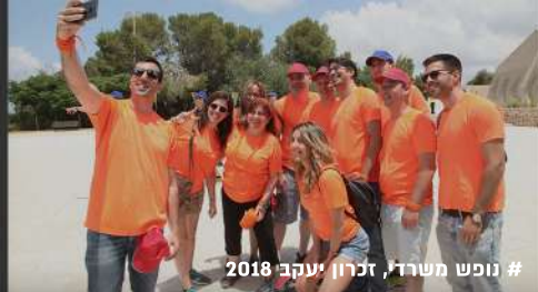
# נופש משרדי, זכרון יעקב 2018