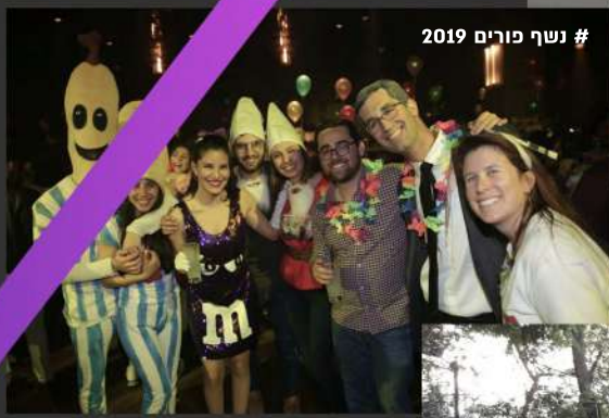
# נשף פורים 2019