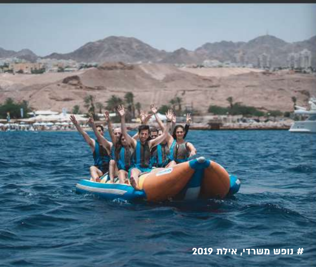
# נופש משרדי, אילת 2019