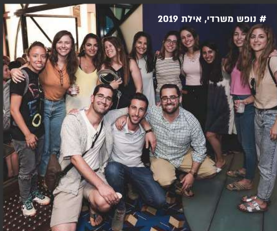
# נופש משרדי, אילת 2019